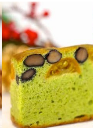
雅・黒豆抹茶けーき