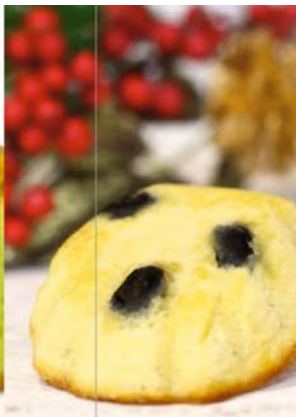
なごみ・黒豆けーき