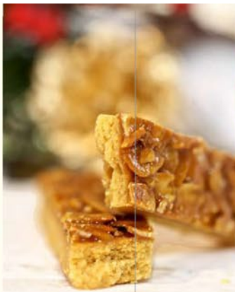
菓子の樹ふるらんたん