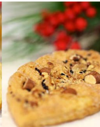
菓樹葉の励まし・ハイリーフ